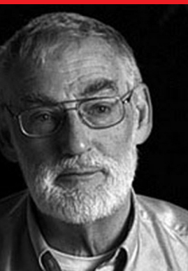
Dennis Meadows

Qu'est-ce qu'un « Retrouvailles » d'Écosociété ? Un livre qui n'a jamais cessé d'être présent chez les militants, sur le terrain. Un texte que l'on aime raconter, comme un mauvais coup. Un outil pour remuer le monde.