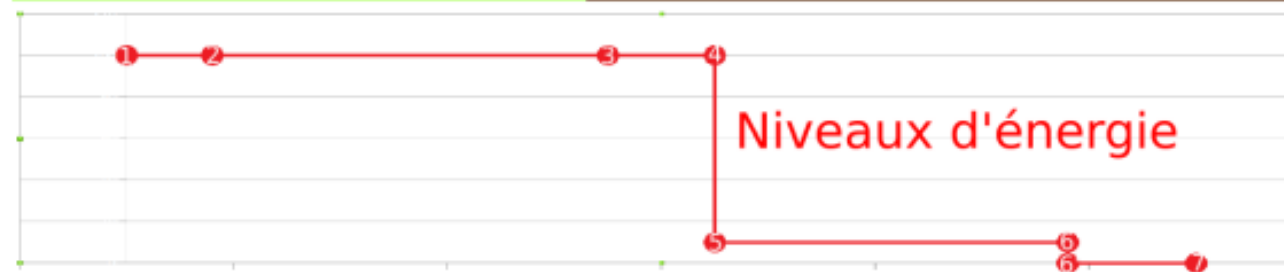
Cheminement de l'énergie dans une installation hydroélectrique